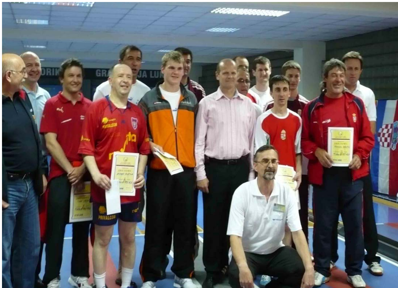
Összkép a „TOP 12”-vel Banja Luka-n (Bosznia Hercegovina)