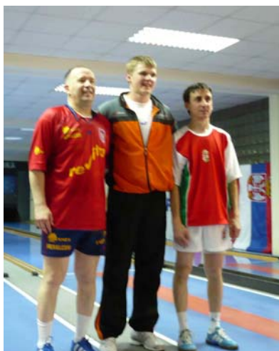
Az egyéni dobogósok