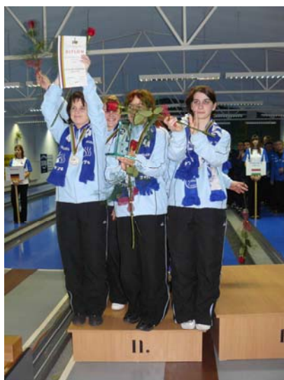
BL II. hely – 2008.: ZTE-ZÁÉV TK