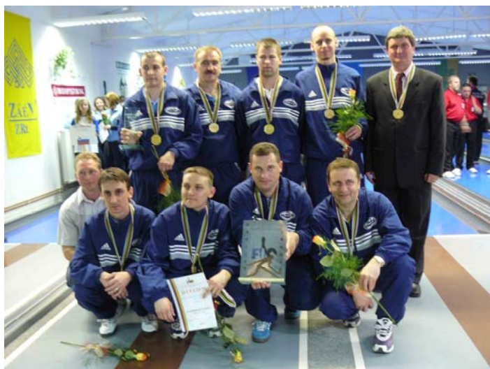
BL győztes – 2008.: ZALAEGERSZEGI TK - FMVAS