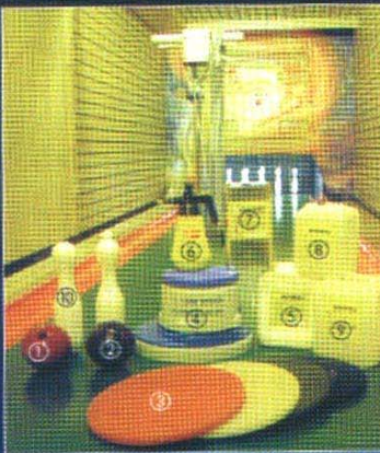
Kegelbahn-Zubehör und Pflegemittel