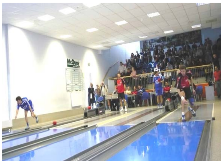
Teltház és világbajnoki döntőnek beillő színvonal jellemezte a Szeged – ZTK szuperrangadót