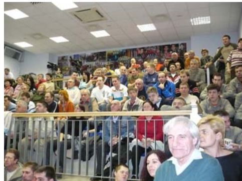
Készült a 2008. évi Szegedi Világranglista versenyen