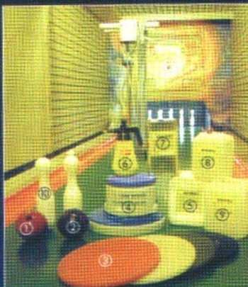
Kegelbahn-Zubehör und Pflegemittel